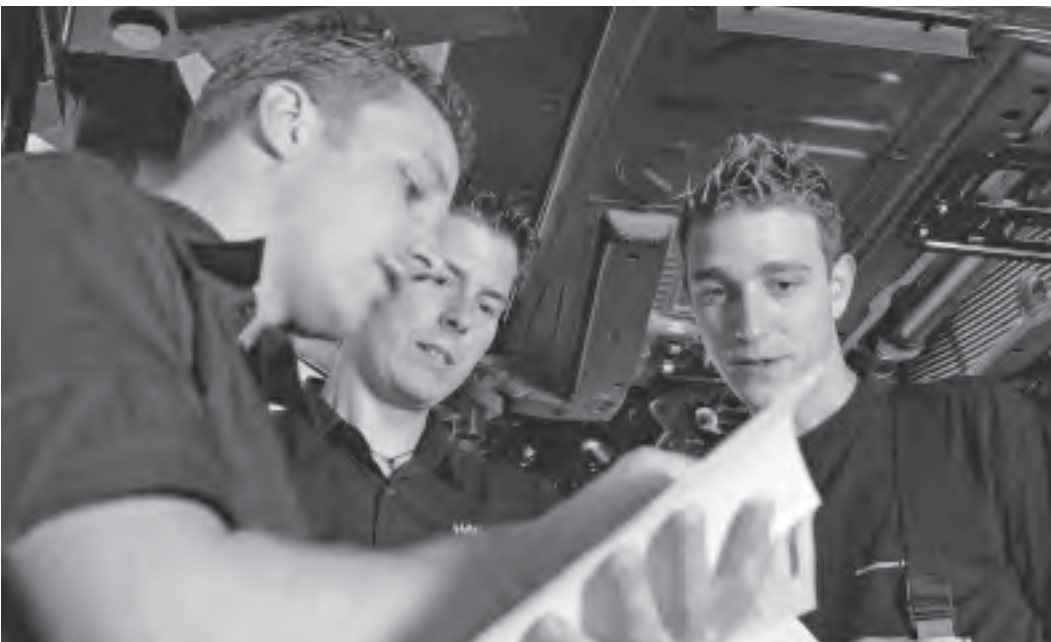
Bild 1: Die Mitwirkung der Mitarbeitenden bei der Gefahrenermittlung und Massnahmenplanung bringt dem Betrieb Vorteile.

Es geht auch darum, die Betroffenen zu Beteiligten zu machen: Wer bei der Gefahrenermittlung und Massnahmenevaluation mitwirken darf, wird die nötigen Schutzmassnahmen besser akzeptieren und einhalten, als wenn diese einfach von oben befohlen werden.