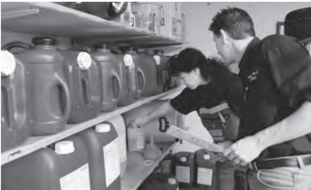
Bild 2: Gefahrenstofflager. Den speziellen Gefahren der eingesetzten Arbeitsstoffe muss Rechnung getragen werden.